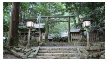
天岩戸神社。御祭神:天照皇大神。