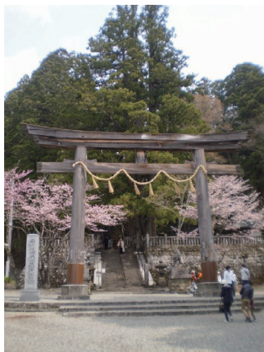
岩戸を開く智慧神を祀る戸隠神社中社。観桜。

本号では、九州、信州と地理的に離れているが、歴史的には近いという霧島連山、戸隠連峰の各最高峰、韓国岳と高妻山を紹介したい。二座とも百名山である。なお、いま韓国岳には、えびの高原から、途中の硫黄山の火山性ガスを避けるように回り道し