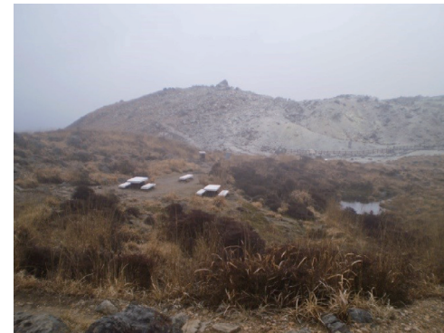
硫黄山遠景。登山時は硫黄臭だけで噴煙はなし。

当日は鹿児島で前泊し、始発ローカル電車で開聞岳駅から開聞岳に登頂し、下山後、バスで指宿まで乗継ぎ、レンタカーを借りて、九州高速道路を通過し霧島火山帯の韓国岳登山口に14時50分着。時間的に余裕がなく