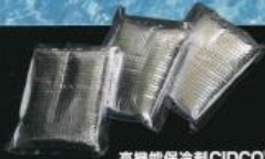
高機能保冷剤CIDCO®COOLは、 繰り返し使用できます。