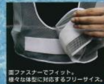
面ファスナーでフィット。 様々な体型に対応するフリーサイズ。