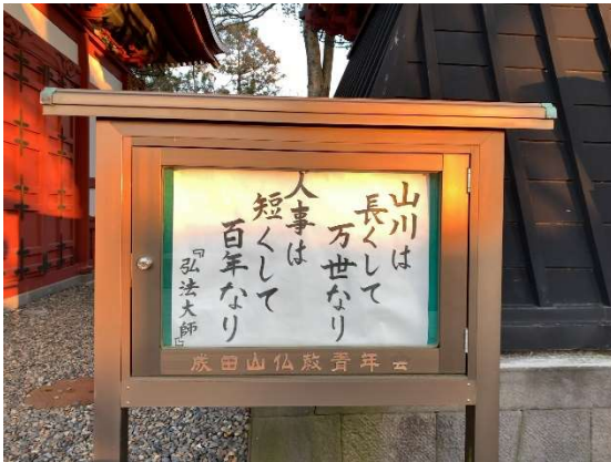
(成田山：悠久の自然観と有限の人生訓)