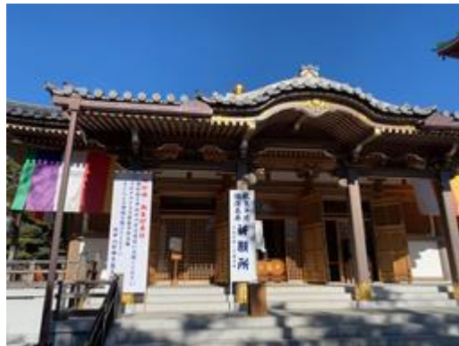
(新型コロナウイルスの収束、終息を祈願)